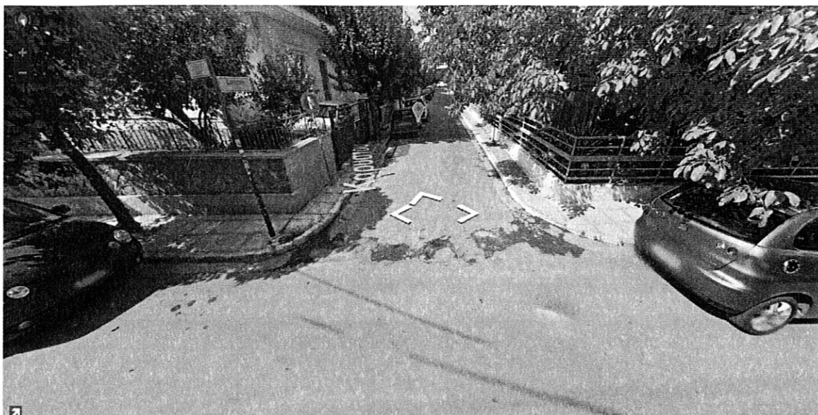
ΣΧΗΜΑ 1. Οδός Καρύστου