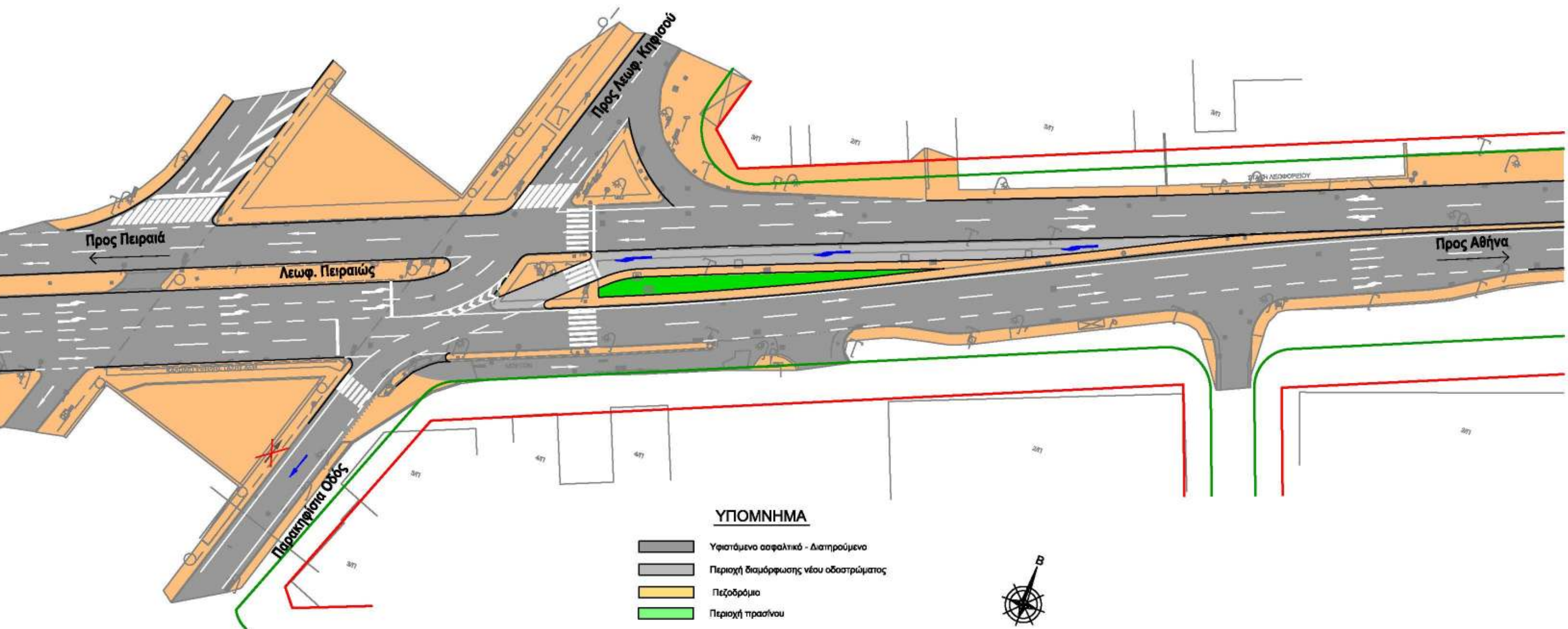
Σχήμα 2. Σκαρίφημα οριζοντιογραφίας – Εφαρμογή νέας αριστερής στροφής