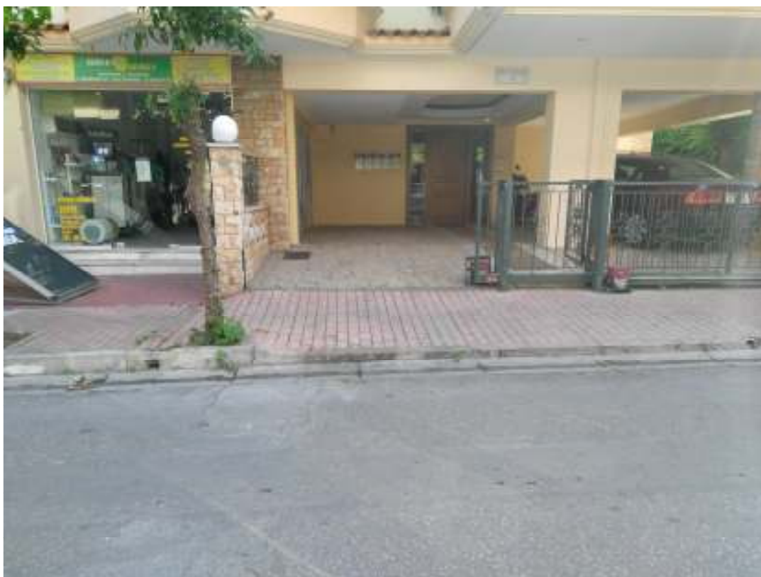
1Η ΠΕΡΙΠΤΩΣΗ ΓΡ. ΛΑΜΠΡΑΚΗ 15, ΤΑΥΡΟΣ