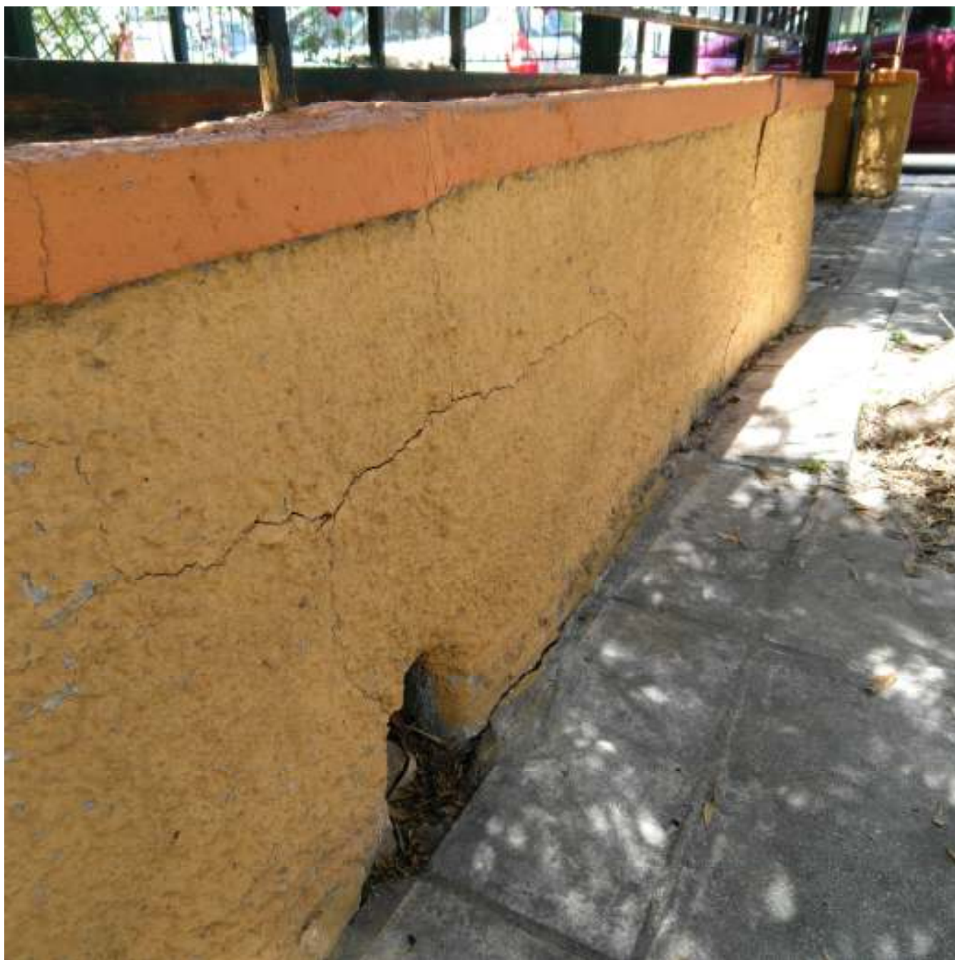
ΘΕΡΜΟΠΥΛΩΝ 44, ΜΟΣΧΑΤΟ