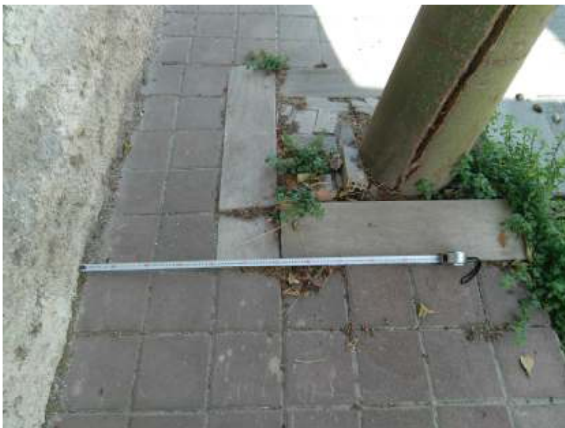
2Η ΠΕΡΙΠΤΩΣΗ ΑΦΡΟΔΙΤΗΣ 10 & ΠΛΟΥΤΩΝΟΣ