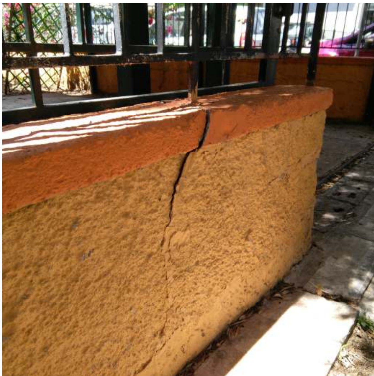
ΘΕΡΜΟΠΥΛΩΝ 44, ΜΟΣΧΑΤΟ