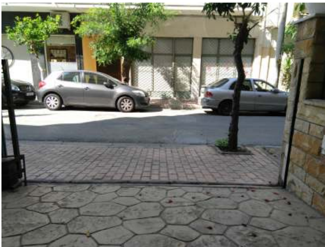
1Η ΠΕΡΙΠΤΩΣΗ ΓΡ. ΛΑΜΠΡΑΚΗ 15, ΤΑΥΡΟΣ