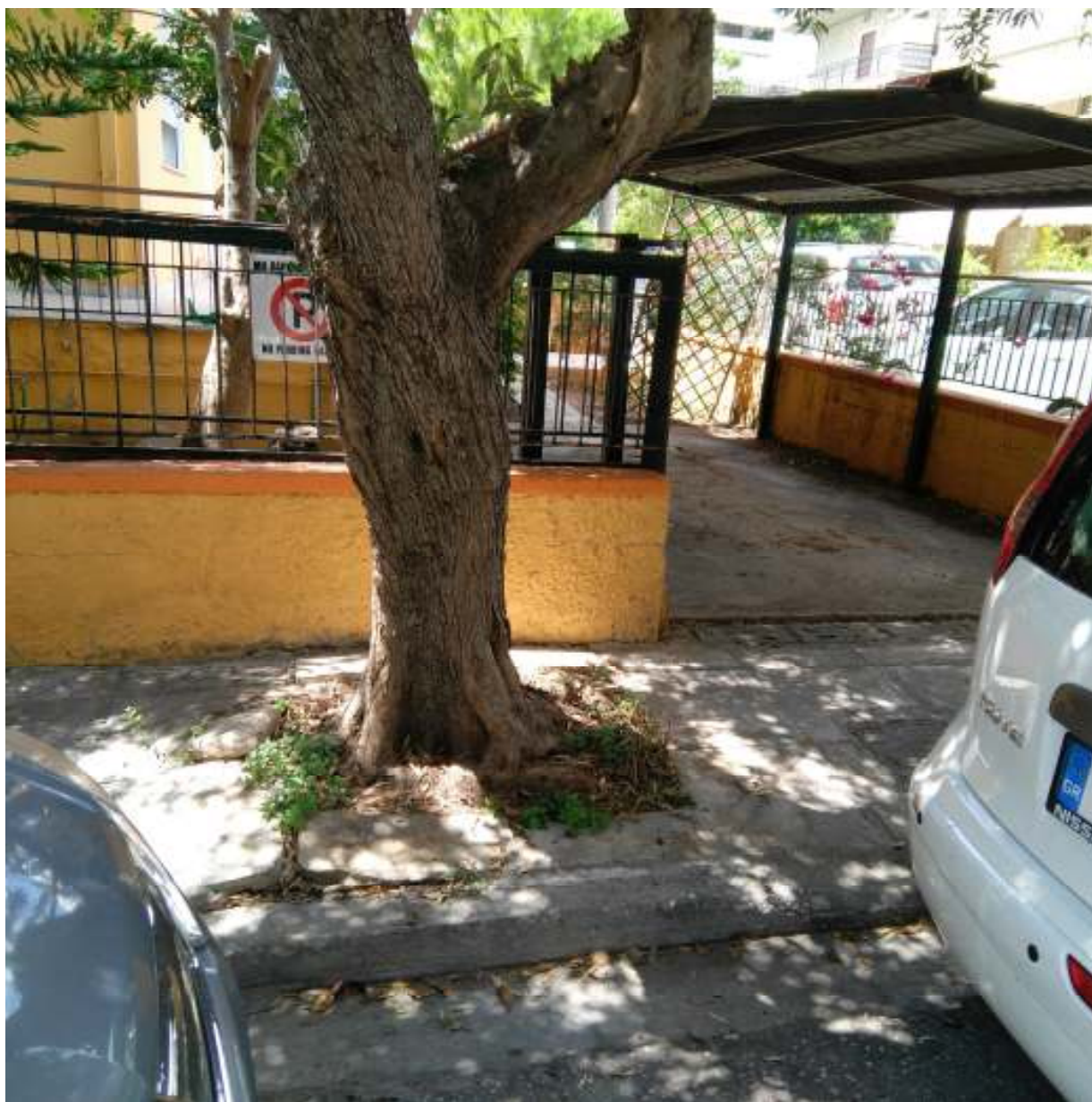
ΘΕΡΜΟΠΥΛΩΝ 44, ΜΟΣΧΑΤΟ