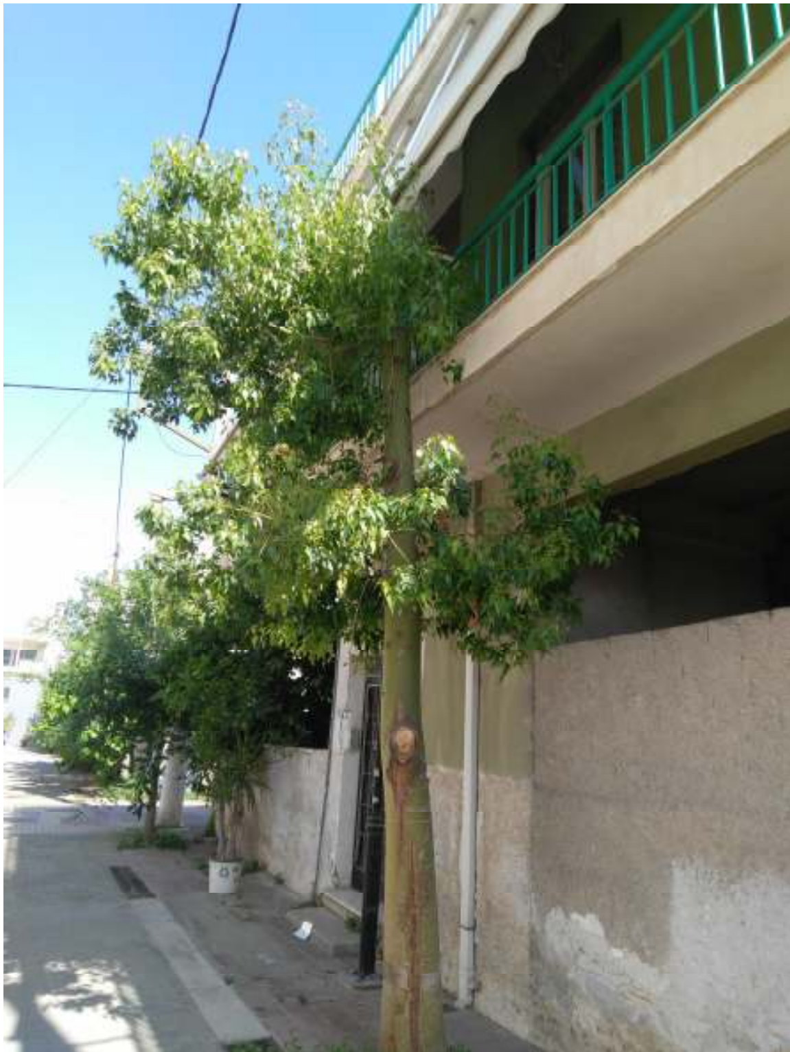
2Η ΠΕΡΙΠΤΩΣΗ ΑΦΡΟΔΙΤΗΣ 10 & ΠΛΟΥΤΩΝΟΣ