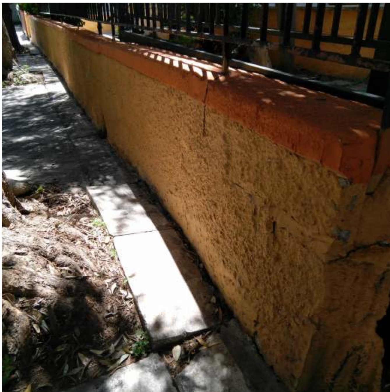
ΘΕΡΜΟΠΥΛΩΝ 44, ΜΟΣΧΑΤΟ