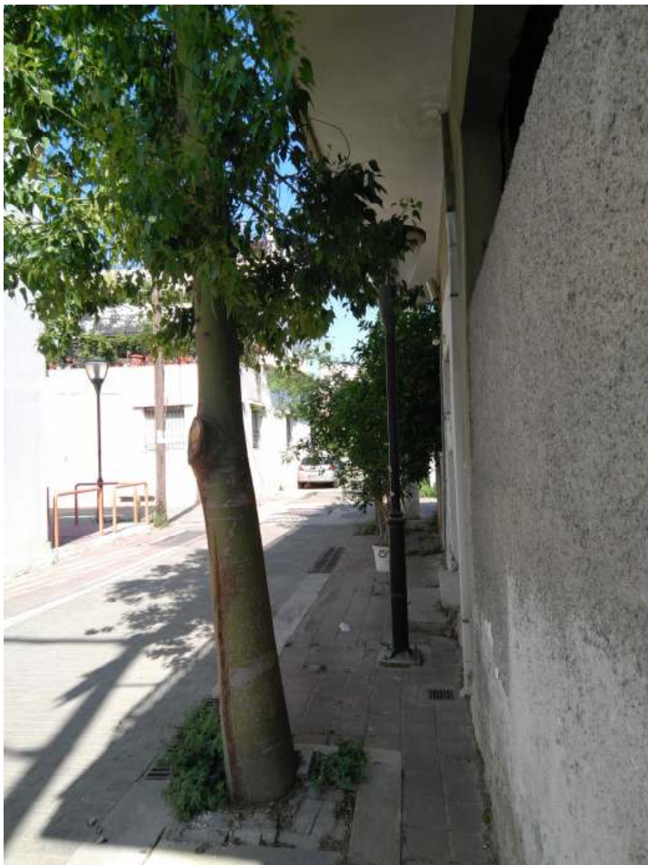
2Η ΠΕΡΙΠΤΩΣΗ ΑΦΡΟΔΙΤΗΣ 10 & ΠΛΟΥΤΩΝΟΣ