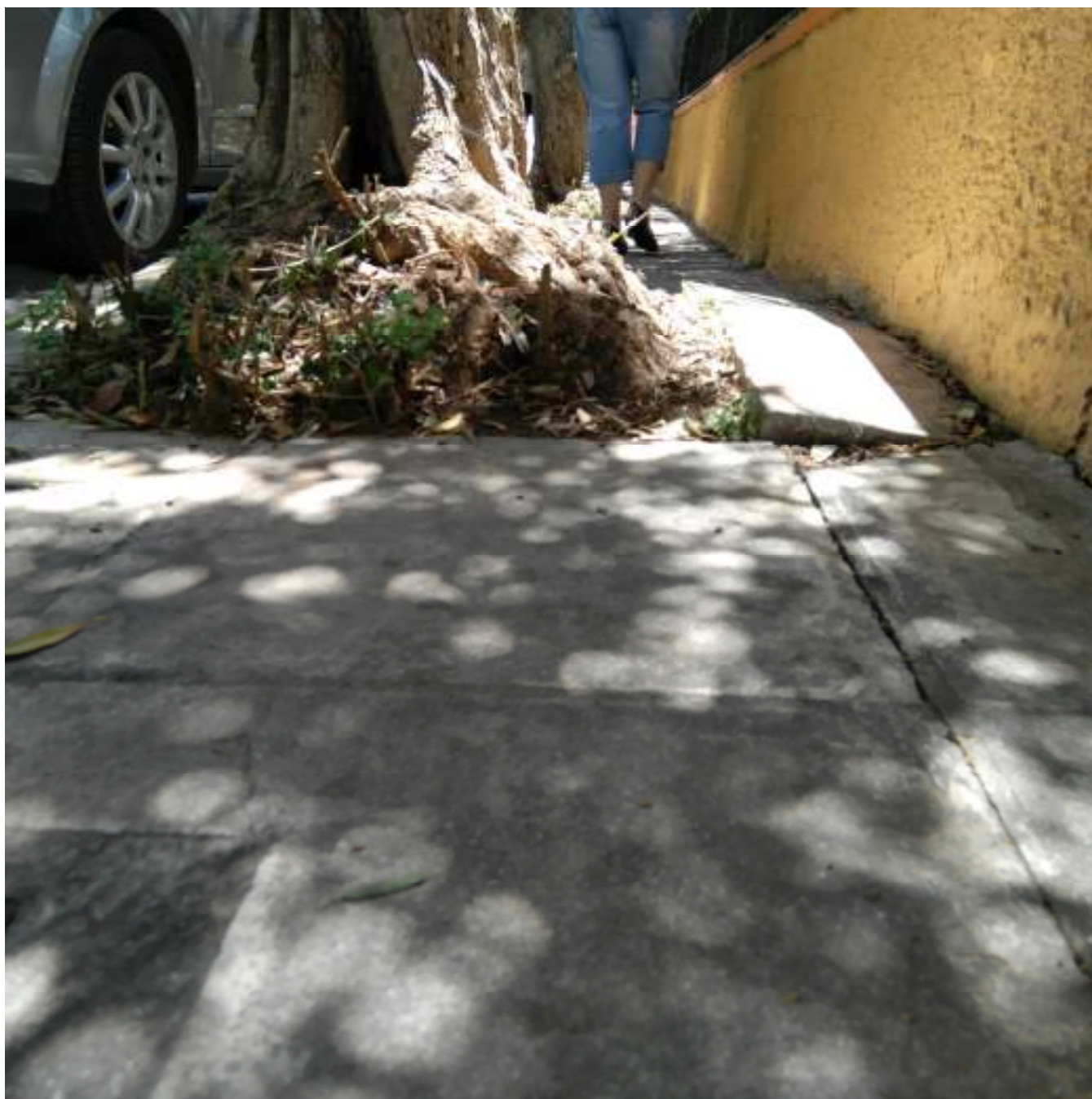
ΘΕΡΜΟΠΥΛΩΝ 44, ΜΟΣΧΑΤΟ