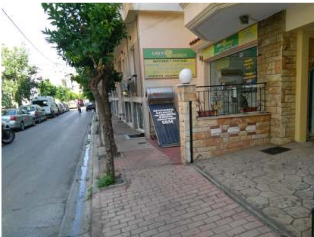
1Η ΠΕΡΙΠΤΩΣΗ ΓΡ. ΛΑΜΠΡΑΚΗ 15, ΤΑΥΡΟΣ